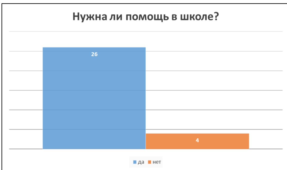
Рис. 3. Распределение ответов на вопрос: нужна ли помощь в школе?

Школьный климат играет ключевую роль в профилактике буллинга. Учителя и администрация школы должны создавать атмосферу нетерпимости к любым проявлениям насилия. Важно проводить воспитательную работу с учащимися, объясняя последствия буллинга и важность уважительного отношения к другим. Также необходимо организовать группы поддержки для жертв буллинга и работу с агрессорами [1].