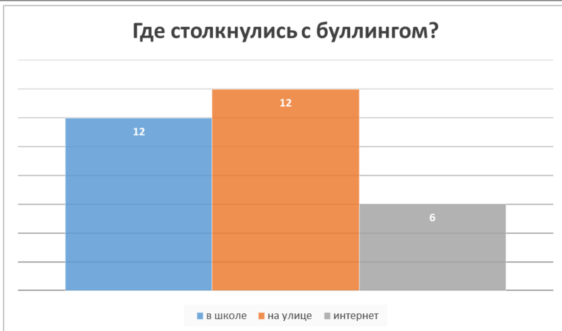
Рис. 4. Распределение мест столкновения с буллингом среди учащихся (в школе, на улице, в интернете)

Диаграмма с результатами опроса о форме буллинга, с которой встречались опрошенные.