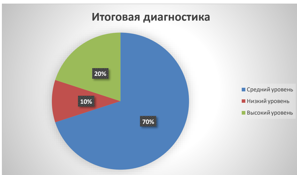
Рис. 2 Результаты итоговой диагностики

Из диаграмм видна положительная динамика компонентов речевого развития, так как количество детей с низким уровнем к концу учебного года уменьшилось в два раза. Входящая диагностика не выявила детей с высоким уровнем речевого развития. Количество детей, находящихся на среднем уровне увеличилось на 50%. Ниже среднего уровня остался один ребенок в связи с низкой посещаемостью занятий по логоритмике.