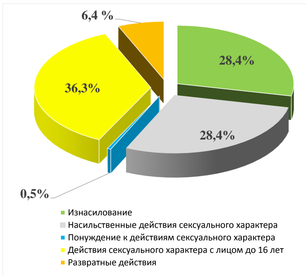
Рисунок 2 – Структура преступности против половой неприкосновенности и половой свободы личности в РФ (по данным за 2018 г) в процентном соотношении

Изложенное позволяет сделать вывод о том, что подходы к данным статистики в области совершения преступлений данной категории, требуют пересмотра хотя бы один раз в 5 лет. Так, преступление, которое является «лицом» всех преступлений против половой неприкосновенности и половой свободы личности – изнасилование – в настоящее время уже несколько лет занимает вторую или третью позицию в структуре половых преступлений.