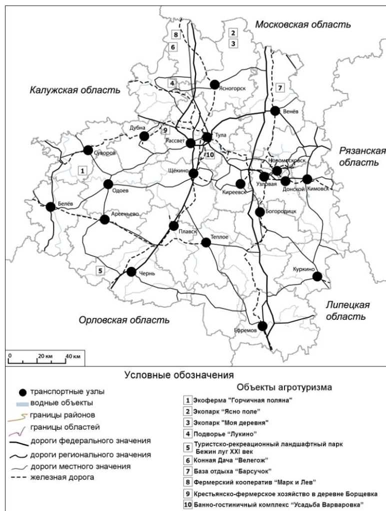
Рисунок 2 - Каркас агротуризма Тульской области

10. Банно-гостиничный комплекс «Усадьба Варваровка» Тульская область, Ленинский район, деревня Варваровка [10]. Туристам предлагается размещение с питанием на основе экологически чистых продуктов, освоение народных промыслов и ознакомление с фольклорными особенностями.